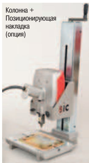
Колонна + Позиционирующая накладка (опция)