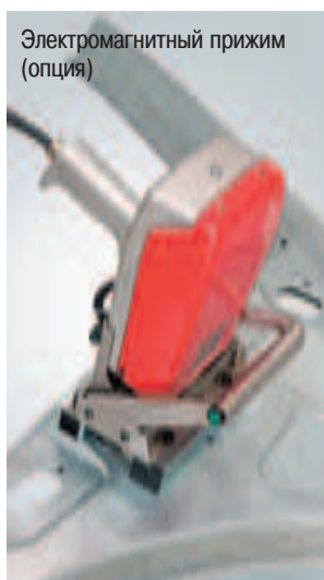
Электромагнитный прижим (опция)