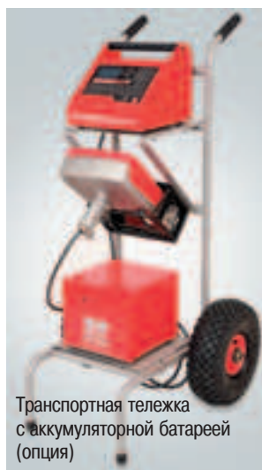
Транспортная тележка с аккумуляторной батареей (опция)