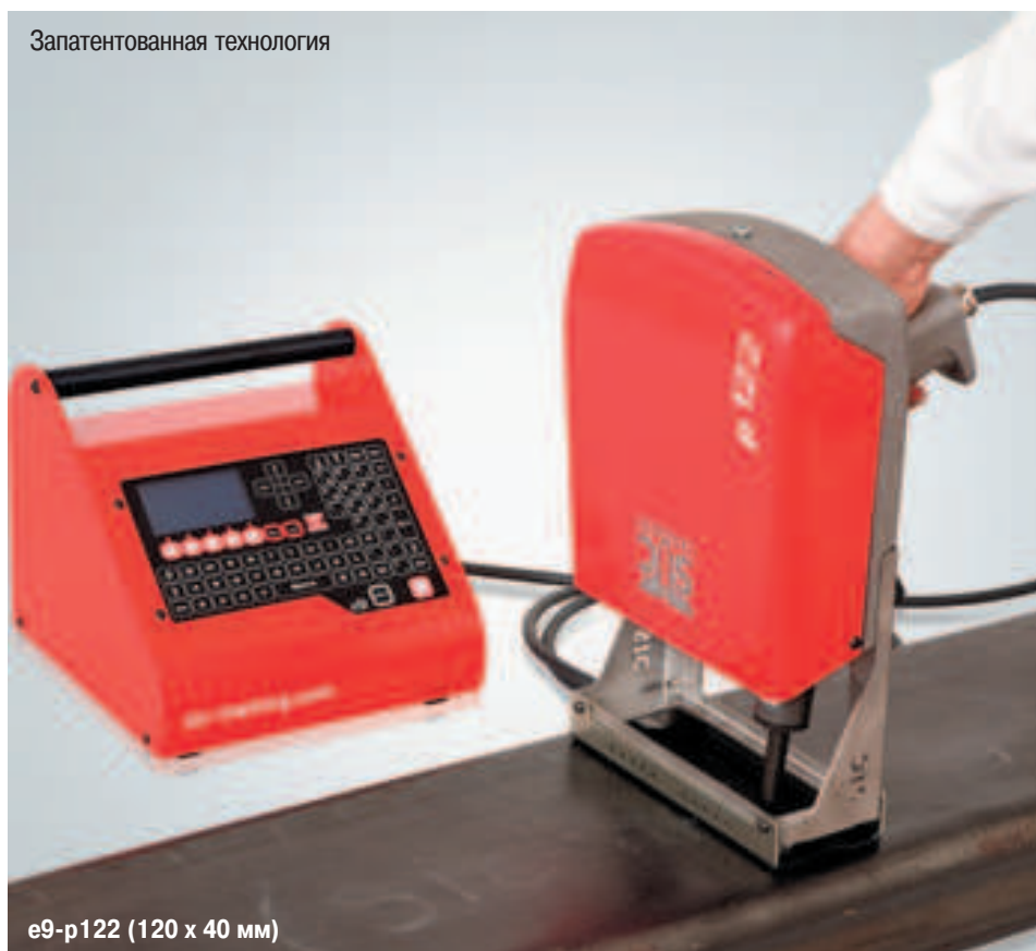
e9-p122 (120 x 40 мм)