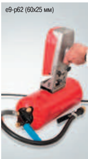
e9-p62 (60x25 мм)