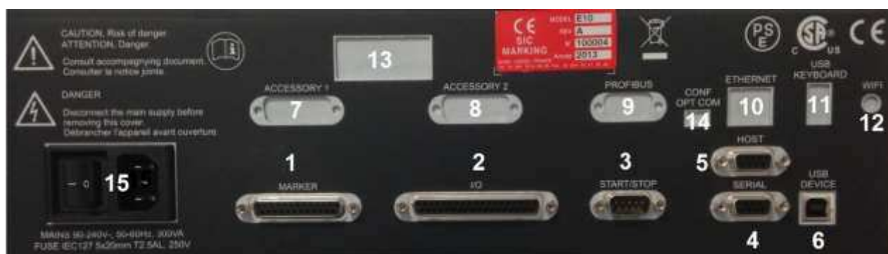
Рисунок 1: Задняя сторона e10